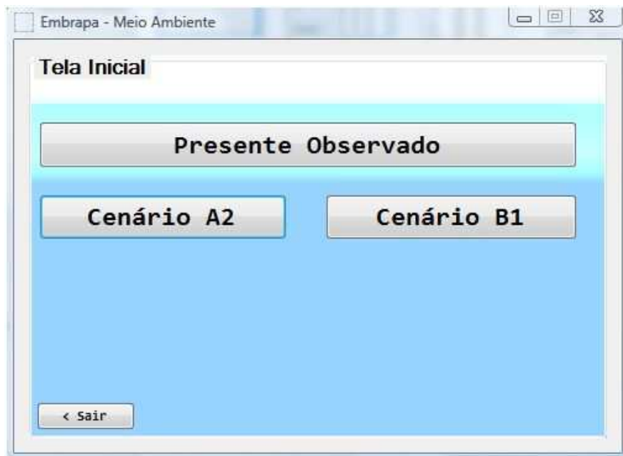
Figura 2. Tela Principal com opções de Presente Observado e cenários A2 e B1.